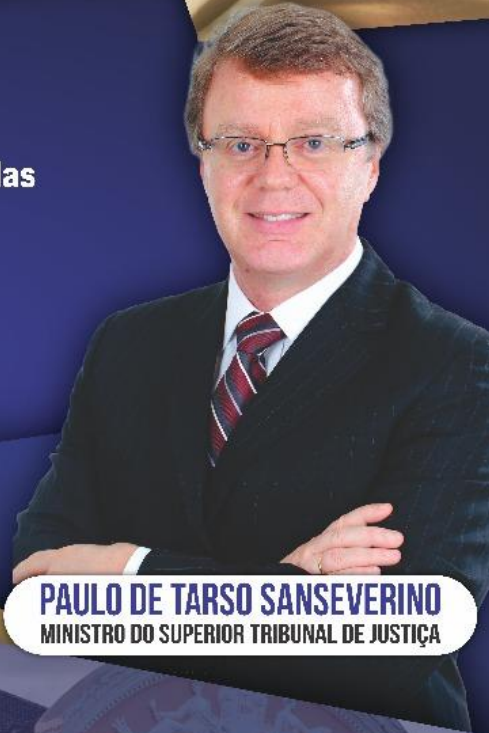
PAULO DE TARSO SANSEVERINO MINISTRO DO SUPERIOR TRIBUNAL DE JUSTIÇA

DA VINCI HOTEL E CONVENÇÕES, Nº 240 A BAIRRO ADRIANÓPOLIS - MANAUS – AM